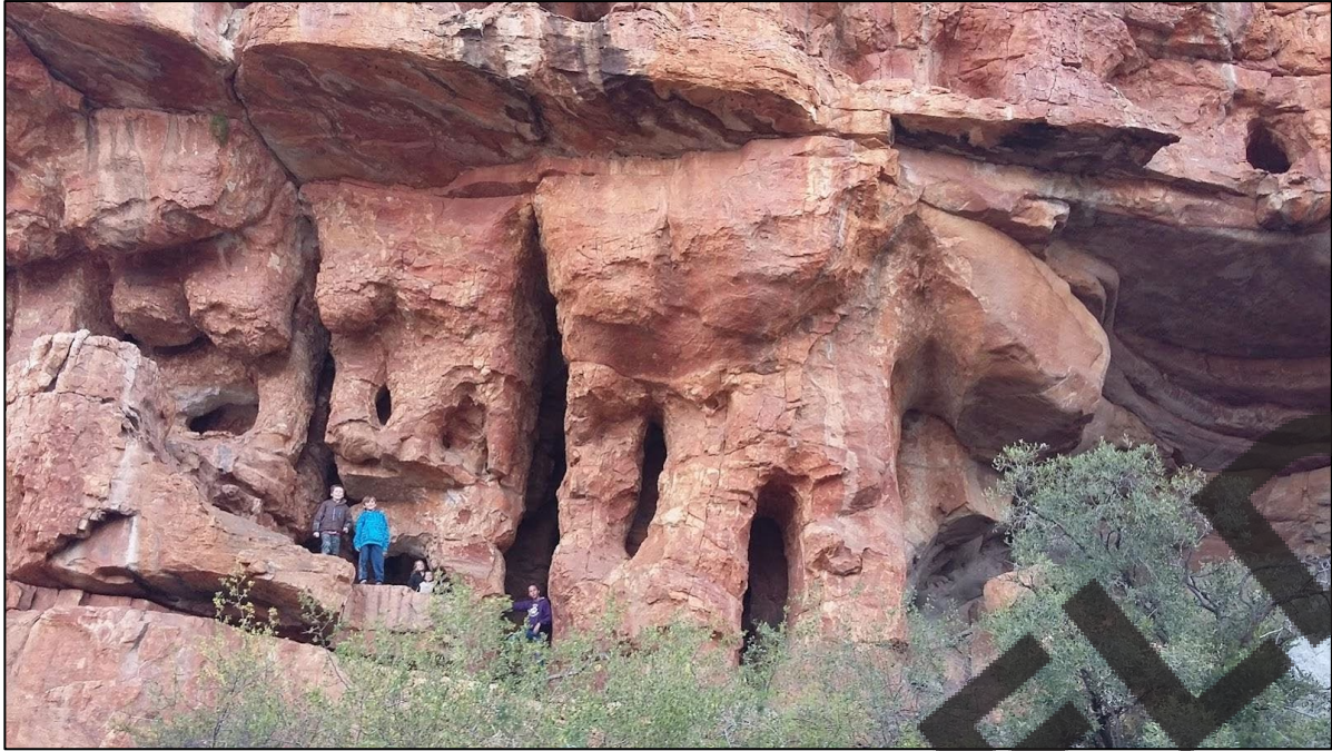
Stadsaalgrotte, Cederberg, Wes-Koap

"Sanskilderye en graveerkuns kom in die hele Afrika voor, nie net in die Cederberg nie, en dit beteken dat hierdie mense eens op baie plekke regoor die vasteland rondgedwaal het. Die rotstekeninge onthul aspekte van hul lewens, soos jag en kamliewe, die versameling van heuning en plantvoedsel.