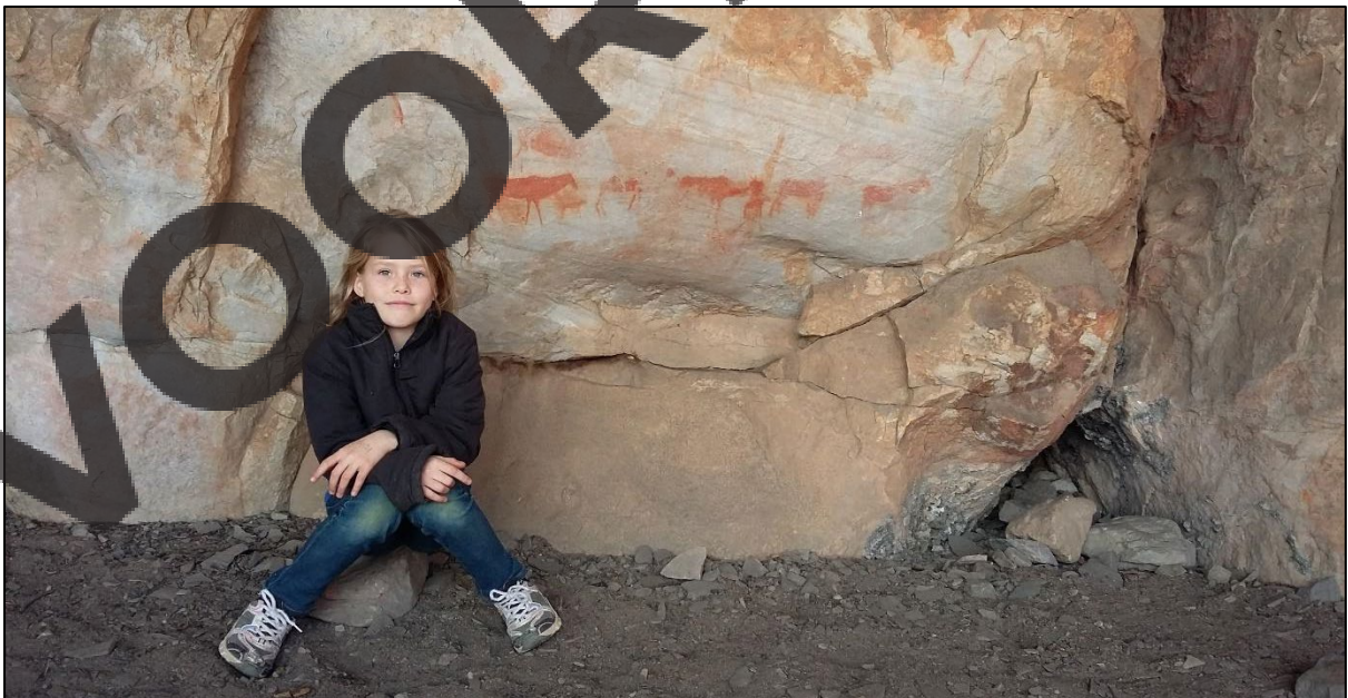
San-rotskuns, Cederberg, Wes-Kaap

"Maar ons eerste Suid-Afrikaanse nomades was jagter-versamelaars, wat eenvoudige lewens in 'n gemeenskap geleef het. Hierdie gemeenskappe sou die kuddes volg wat in verskillende seisoene na verskillende gebiede verhuis het. Later het sommige stamme veewagters geword. Terwyl hulle gereis het, het hulle ook spore van hul lewens agtergelaat.