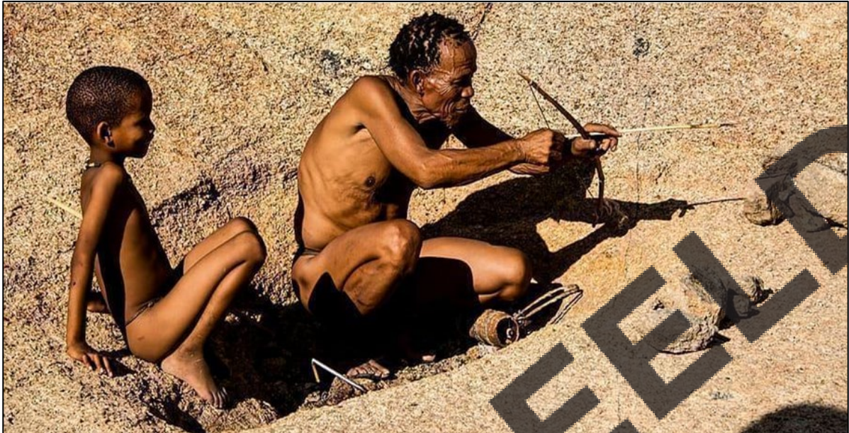
'n Sanman demonstreer hoe om met 'n pyl en boog te jag.